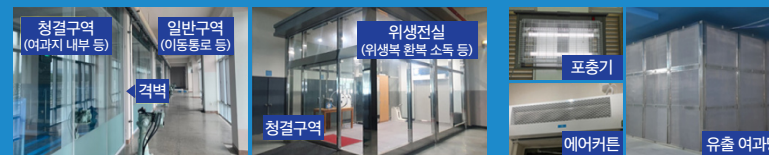
위생 전실 설치