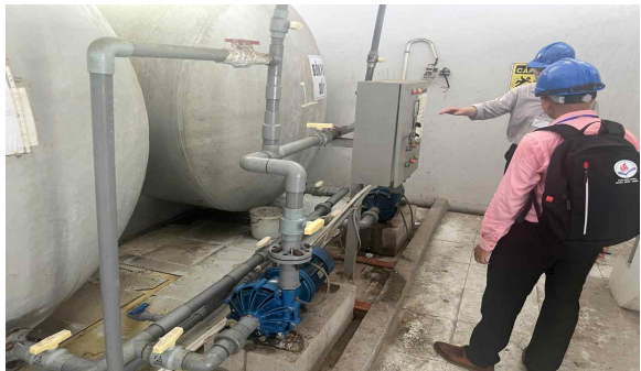
켄동 정수장 AI 도입 전 시스템 및 인프라 현황 점검