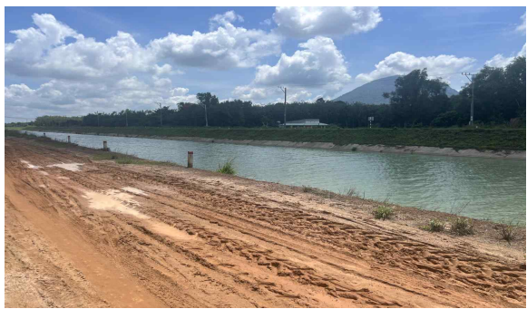
떠이닌성 바우낭 상수도 투자사업 현장조사, 공정점검