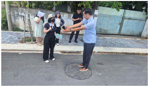
호찌민 하수도 사업 현장조사, 계약업무 협의 등