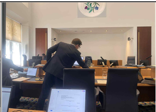
【SHPL 변호인 변론 준비】