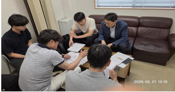
데이트시트 검사결과 확인