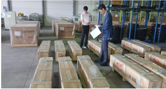
Box 등 수량검사