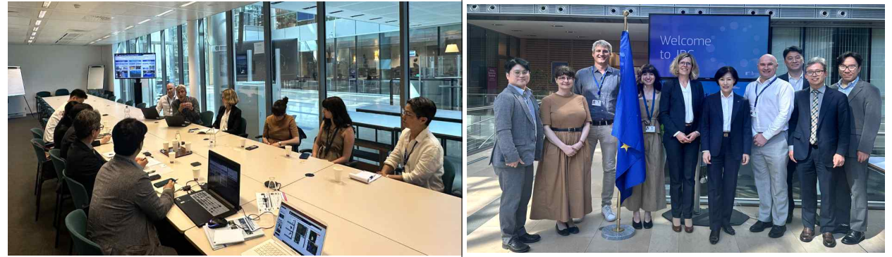
< DG RTD 정책면담 및 협력 협의 >