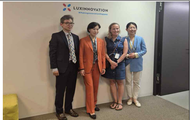
< 룩셈 국가혁신기관(Luxinnovation) 협력협의 >