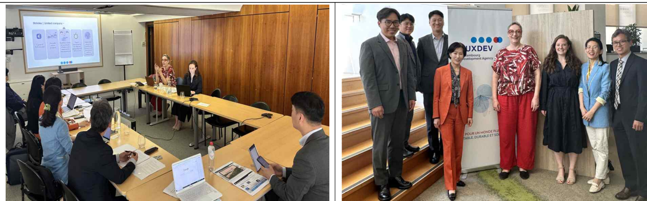
< LuxDev 국제개발 협력협의 >