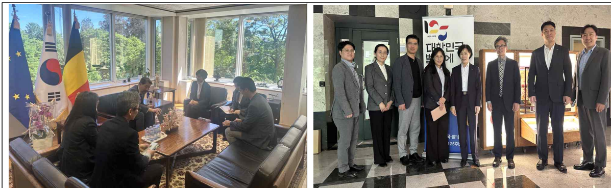
< 대사 정책 면담 및 공관 실무협력채널 구축 >