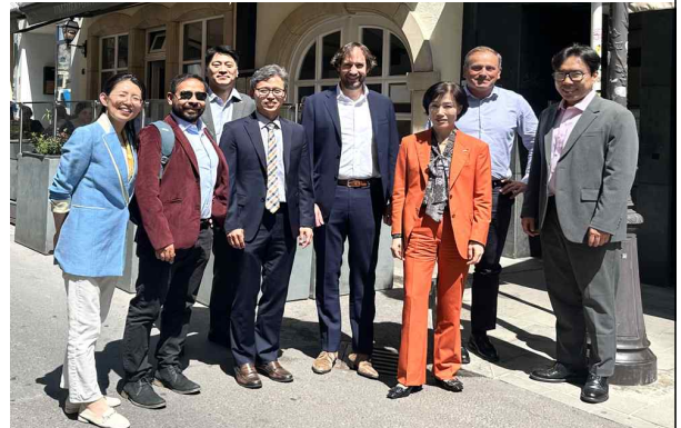
< 룩셈 산업연맹(FEDIL) 오찬간담회 >