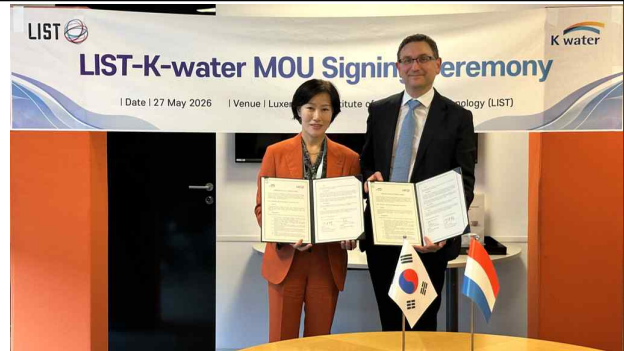
< 룩셈 과학기술연구원(LIST) MOU 체결 >