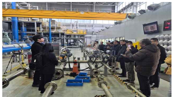
현장 견학 (화성(정), 시화조력, 물관리 종합상황실, 성능시험센터)