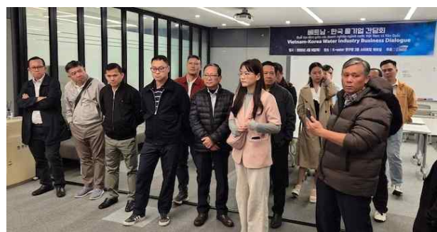
기자재 박람회 및 간담회 참석