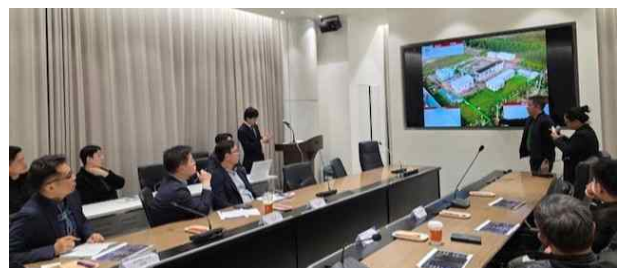
사업 제안 및 협의